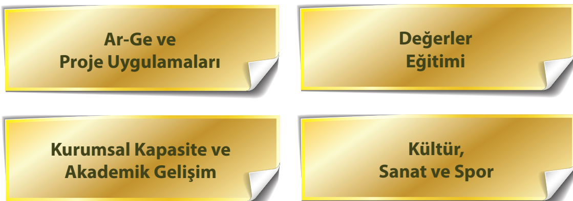
Şekil 1. Serginin Tematik Alanları

İmam Hatip Okullarında Başarılı Örnek, öğrencilerin öğrenmesine ve akademik gelişimine katkı sağlayan, bilimsel faaliyetler ile sistemli bir şekilde ilerlemeyi öğretene, kültür, sanat ve spor faaliyetleri ile öğrencilerin gelişimini destekleyen, değerleri davranış haline getiren bireyleri yetiştiren, öğretmen ve yöneticilerin mesleki gelişimi yoluyla kurumsal kapasitelerini artıran, proje uygulamaları ile gözlemlenen veya ihtiyaç duyulan bir alana yönelik çözüm üreten ve böylece eğitim ve öğretimin iyileştirilmesine yönelik değişim ve dönüşüm oluşturan çalışma/uygulama/projedir. Başarılı Örnekler Sergisi dört tematik alanda düzenlenmektedir.