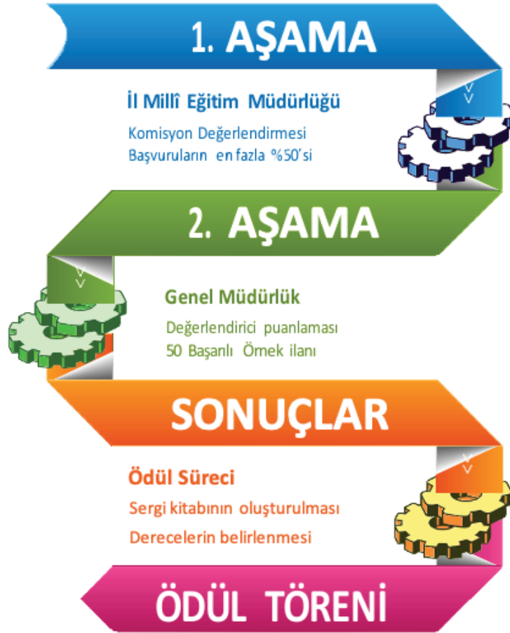
Şekil 3. Başvuruların Değerlendirilme Süreci