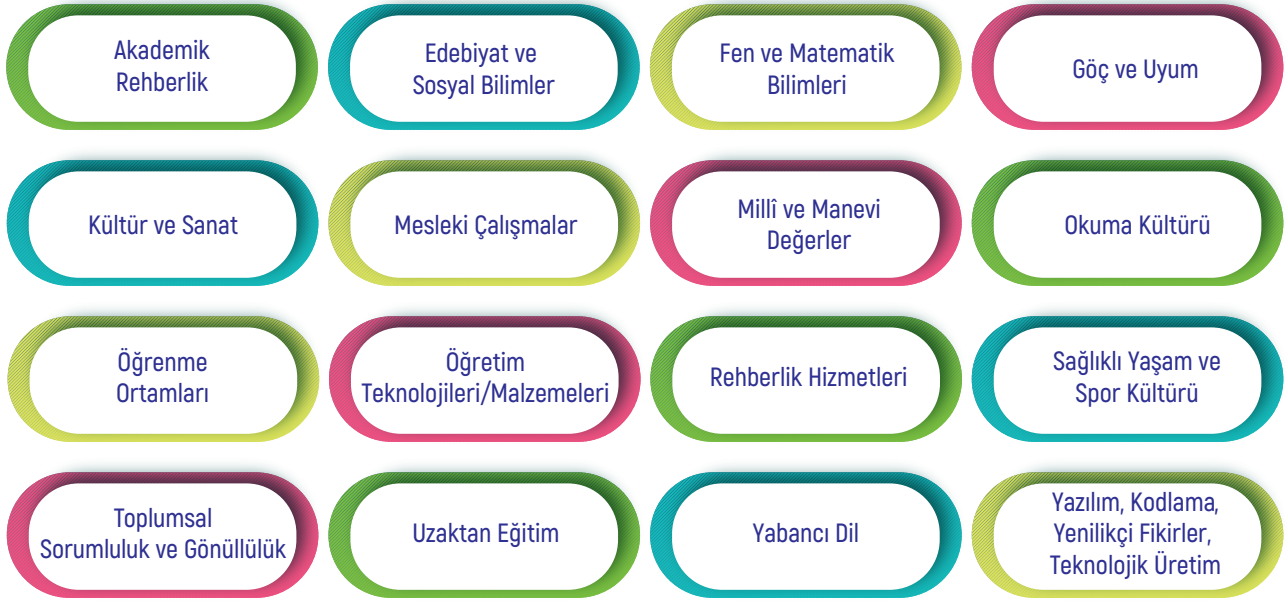
Şekil 2. Serginin Kategorik Alanları

Kategorik alanlara ilişkin verilen bilgiler bir çerçeve çizilmesine yöneliktir. Başvurusu yapılan başarılı örneğin hedef kitlesi okul içinde öğrenci, öğretmen, yönetici, veli olabileceği gibi diğer okullar, kurum ve kuruluşlar veya toplum olabilir. Bu anlamda kategorik alanların kapsamı daha geniş düşünülebilir. Sergi dört tematik alanda yapılacağı için kategorik alanların tematik alan ile ilişkisinin kurulması gerekmektedir. Örneğin göç ve uyum kategorik alanında yapılan bir çalışma akademik gelişime yönelik ise “kurumsal kapasite ve akademik gelişim” tematik alanından; değerler eğitimine yönelik ise “değerler eğitimi” tematik alanından başvuru yapılmalıdır. Sergiye başvuracak projelerin aşağıda verilen kategorik alanlardan birini kapsayacak şekilde hazırlanması gerekmektedir (Şekil 2).