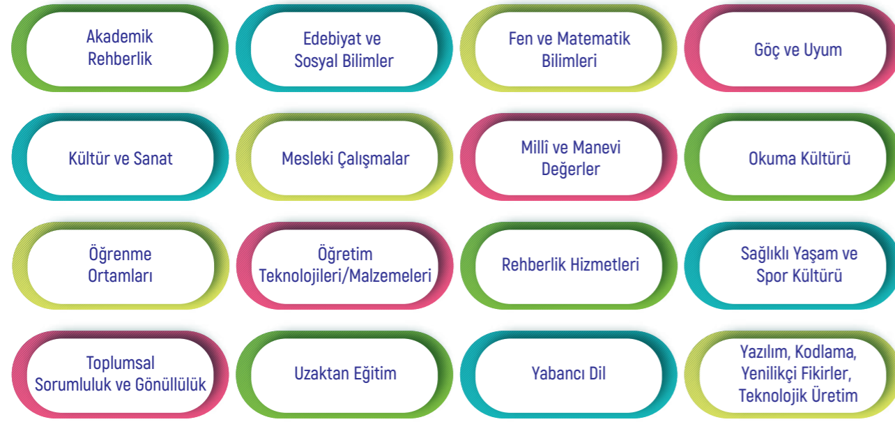
Şekil 2. Serginin Kategorik Alanları

Kategorik alanlara ilişkin verilen bilgiler bir çerçeve çizilmesine yöneliktir. Başvurusu yapılan başarılı örneğin hedef kitlesi okul içinde öğrenci, öğretmen, yönetici, veli olabileceği gibi diğer okullar, kurum ve kuruluşlar veya toplum olabilir. Bu anlamda kategorik alanların kapsamı daha geniş düşünülebilir. Sergi dört tematik alanda yapılacağı için kategorik alanların tematik alan ile ilişkisinin kurulması gerekmektedir. Örneğin göç ve uyum kategorik alanında yapılan bir çalışma akademik gelişime yönelik ise "kurumsal kapasite ve akademik gelişim" tematik alanından; değerler eğitimine yönelik ise "değerler eğitimi" tematik alanından başvuru yapılmalıdır. Sergiye başvuracak projelerin aşağıda verilen kategorik alanlardan birini kapsayacak şekilde hazırlanması gerekmektedir (Şekil 2).