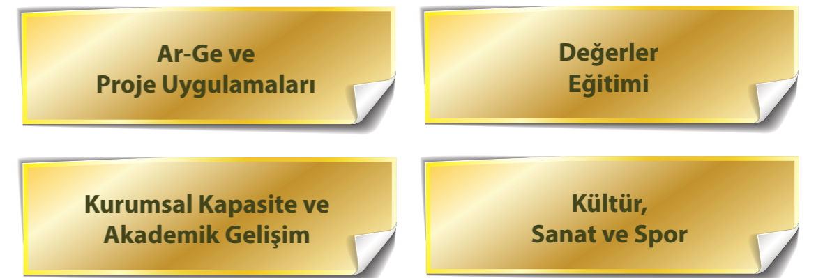
Şekil 1. Serginin Tematik Alanları

İmam Hatip Okullarında Başarılı Örnek, öğrencilerin öğrenmesine ve akademik gelişimine katkı sağlayan, bilimsel faaliyetler ile sistemli bir şekilde ilerlemeyi öğreten, kültür, sanat ve spor faaliyetleri ile öğrencilerin gelişimini destekleyen, değerleri davranış haline getiren bireyleri yetiştiren, öğretmen ve yöneticilerin mesleki gelişimi yoluyla kurumsal kapasitelerini artıran, proje uygulamaları ile gözlemlenen veya ihtiyaç duyulan bir alana yönelik çözüm üreten ve böylece eğitim ve öğretimin iyileştirilmesine yönelik değişim ve dönüşüm oluşturan çalışma/uygulama/projelerdir. Başarılı Örnekler Sergisi dört tematik alanda düzenlenmektedir.